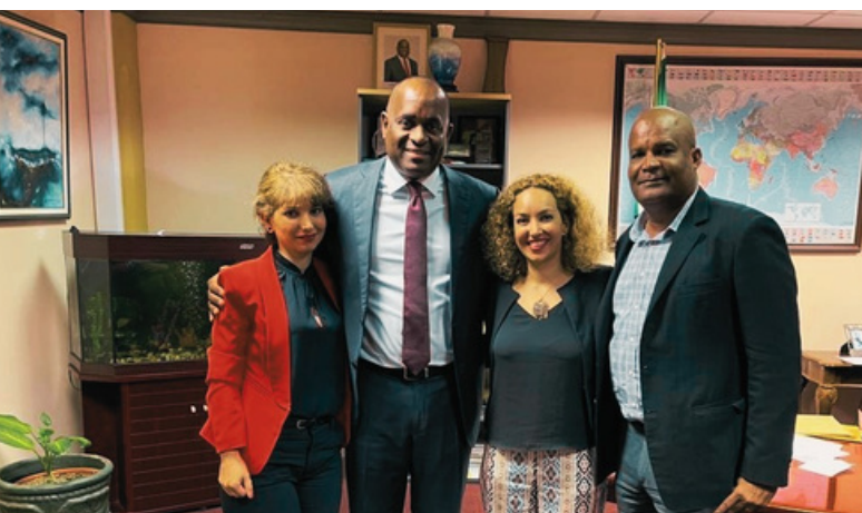
جلسه مدیران کنکاش در دفتر نخست وزیر با جناب آقای روزولت اسکریت نخست وزیر دومینیکا و جناب آقای امانوئل ناتان رئیس واحد اعطای شهروندی دومینیکا

پاسپورت‌ها و گواهی‌های شهروندی همه اعضای خانواده همزمان در دفتر کنکاش به متقاضی تقدیم خواهند شد.