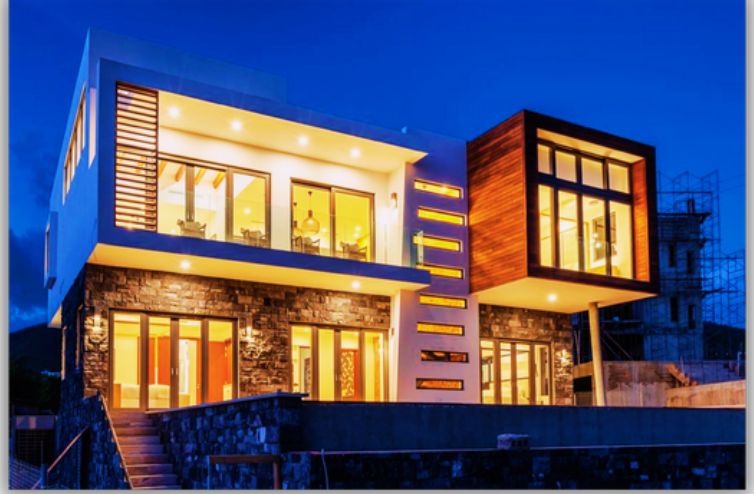
یکی از ویلاهای تکمیل شده پروژه هتل هیلتون