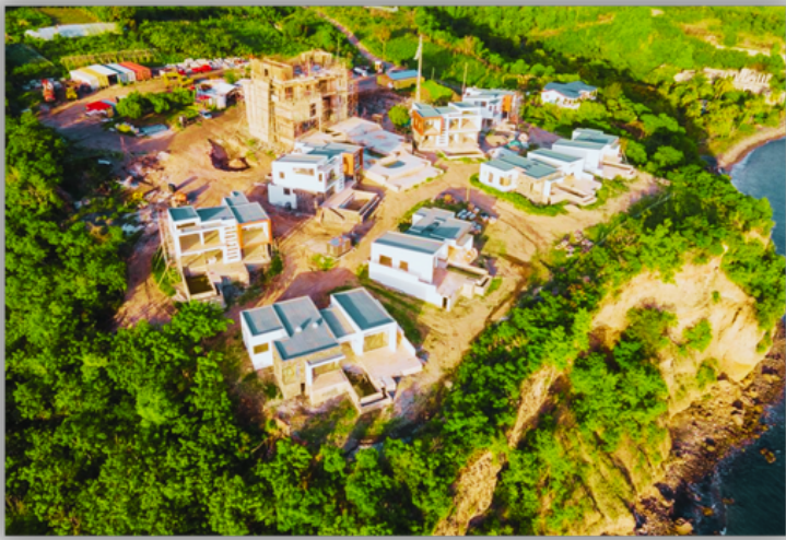
پروژه در حال ساخت هتل هیلتون در دومینیکا